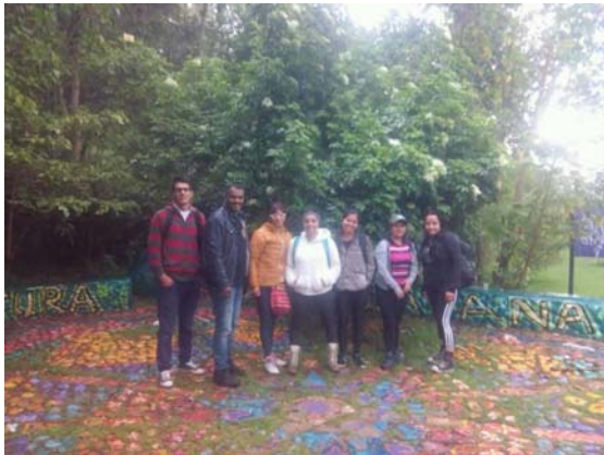
Estudiantes universitarios en el Juanamarillo de la localidad de Suba

Este tríptico va a contener una información importante para que las comunidades y la población en general puedan ser orientadas y guiada hacia el camino que conduce al humedal con interés eco turístico y ambiental.