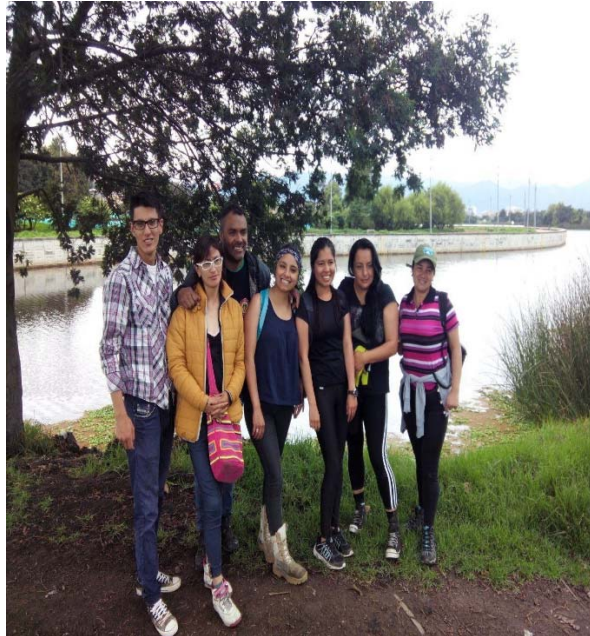
Panorámica del Juanamarillo y los estudiantes en goce pleno de su riqueza ambiental.